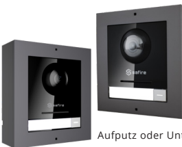
Aufputz oder Unterputz möglich